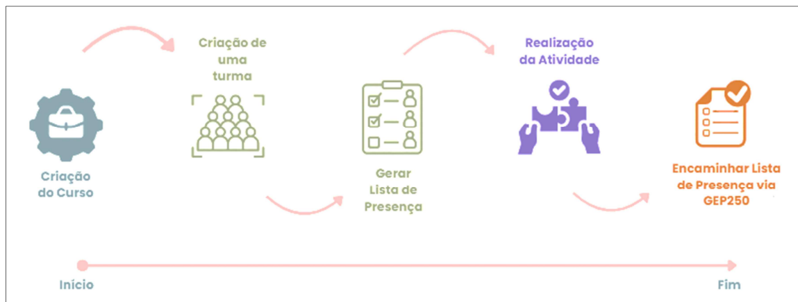
Figura 2 – MACROPROCESSOS